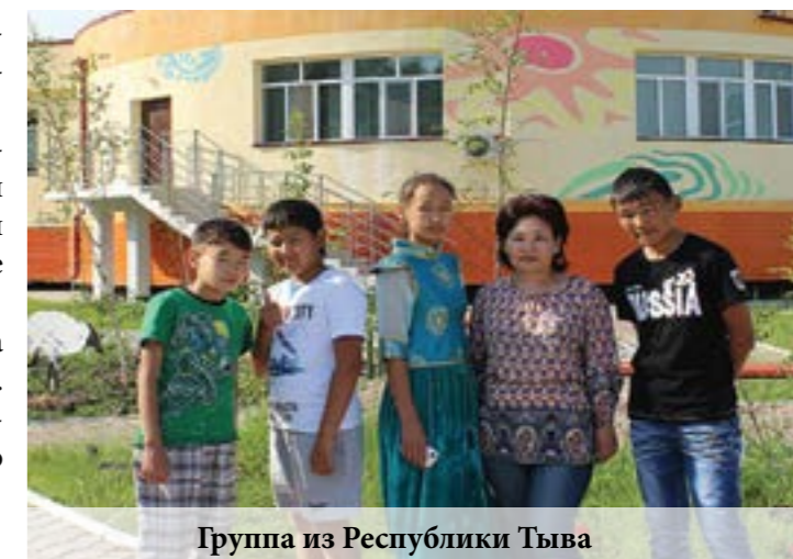
Группа из Республики Тыва

С утра мы учим разные языки, например, учили китайский, немецкий, французский, японский. Было интересно узнать разные языки, особенно китайский и японский!